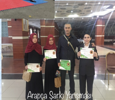
Arapça Şarkı Yarışması